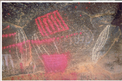
'n Voorbeeld van veewagter-rotskuns met geometriese ontwerpe.

'n Derde rotskunstradisie is onlangs onder omstredenheid in Suid-Afrika geïdentifiseer. Hierdie rotskuns is geëien as dié van die eerste veewagters wat nagenoeg 2000 jaar gelede na suidelike Afrika gemigreer het. Die tradisie bestaan uit geometriese ontwerpe wat met die vingers in oker op die rotse aangebring is of daarop rubekap is, handafdrukke, en vingerstippels. Dit word dikwels in klein, ontoeganklike skuilings of naby water gevind. Voorbeelde van hierdie tradisie kan in dele van die Noordelike Provinsie, die Vrystaat en Noordoos-Kaap gevind word. Geen uitsluitsel is nog gevind oor wat die afbeeldings beteken en waarom dit geskep is nie.