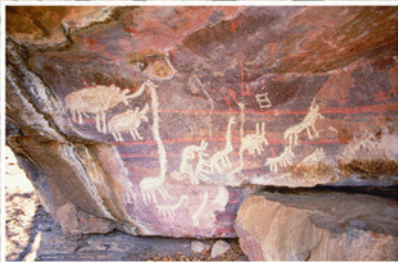
Ystertydperk-diereskilderinge hou met inisiëringspraktyke verband.

Ystertydperk-rotskuns is heelwat skaarser as San-rotskuns. Dit kom in 'n meer beperkte gebied voor, naamlik daardie dele van Suid-Afrika waar Ystertydperklandbouers gewoon het veral die noordoostelike dele van die land. Al die kuns is in die afgelope 2000 jaar geskep. Anders as die veelkleurige San-kuns is die Ystertydperkskilderinge bykans uitsluitlik in wit op die rotse aangebring. Dit is ook dikwels groot, soms etlike meters lank.