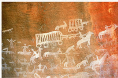
Onlangse Ystertydperkskilderinge van Europese waens en perde.

In die Noordelike Provinsie is daar oënskynlik twee fases van skilderkuns, naamlik 'n vroeë fase met diere wat met inisiëringspraktyke verband hou, en 'n latere fase wat uitbeeldings van Europese setlaars, karavane en waens insluit en oënskynlik as 'n vorm van politieke protes gebruik is.